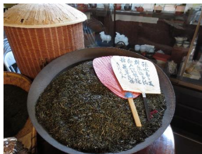
人吉市鍛冶屋町にある立山商店