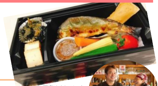
写真はイメージです

車内販売人気商品「くまの宝箱セット」をご提供いただいている「開 Kai」さんの自信作。テーマは、「開 kai の夏休み」で一品一品手作りの最高のおつまみです。ぜひ、ご賞味ください。