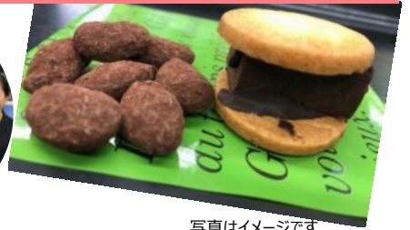
写真はイメージです

車内販売人気商品「くまのスイーツボックス」をご提供いただいている「ポエム」さんによる、初の試みで誕生した「おつまみスイーツ」。絶妙な塩加減が焼酎によく合います！