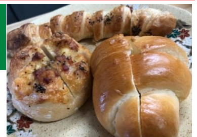
写真はイメージです