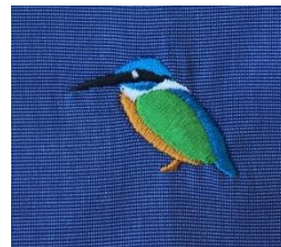
オリジナルの「翡翠」刺繍