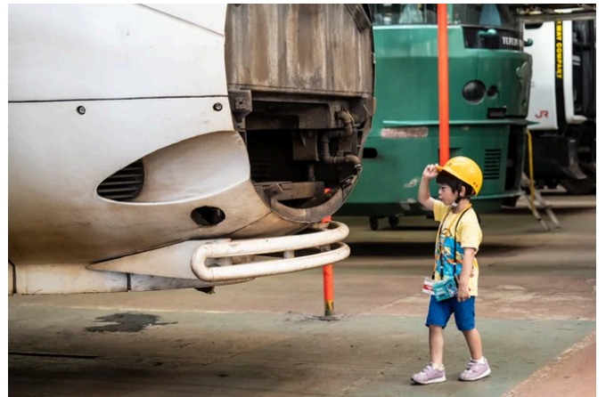
※工場見学のイメージ