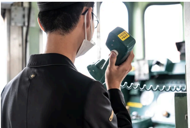
※車内放送体験のイメージ