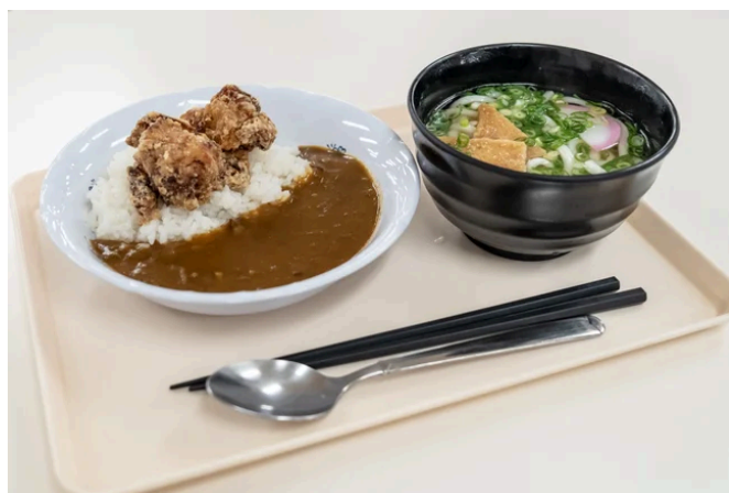
※大人用昼食のイメージ