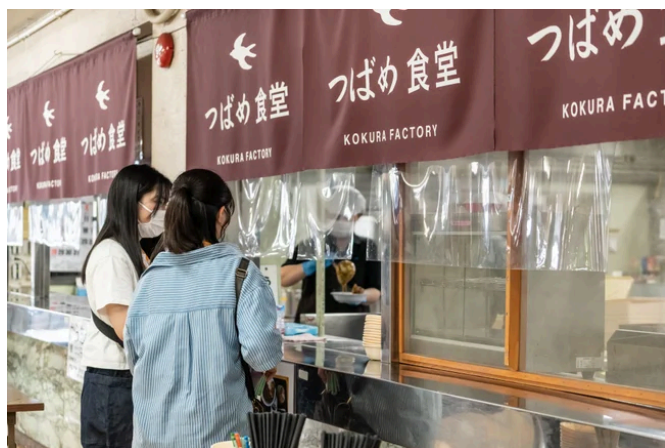
※つばめ食堂のイメージ

“カレー”と“うどん”をセットにしてご用意（お子さまはミニうどんとおにぎりのセットです。）