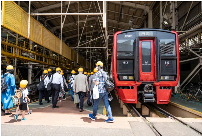
※工場見学のイメージ

■「工場見学」「車内放送体験」「制服試着体験」など、魅力的な体験メニューをご用意！