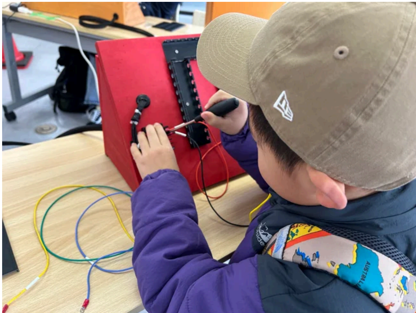
※配線作業体験のイメージ

「配線作業体験」・・・ドライバーを使って正しく配線を繋げて、ライトを点灯しよう！ その他にも技術体験メニューをご用意しております。