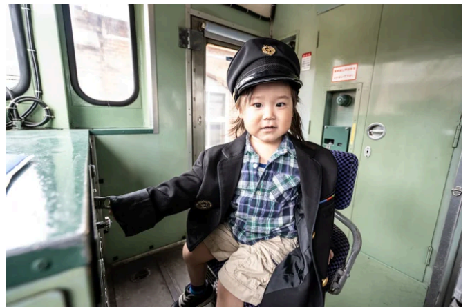
※制服試着体験のイメージ

「車内放送体験」では、実際の車両（キハ40形）を利用し、現役の乗務員が放送のお手伝いをします。