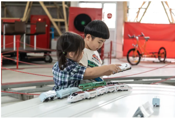
※小倉工場鉄道ランドのイメージ