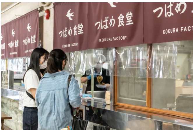
※つばめ食堂のイメージ

“カレー”と“うどん”をセットにしてご用意（お子さまはミニうどんとおにぎりのセットです。）