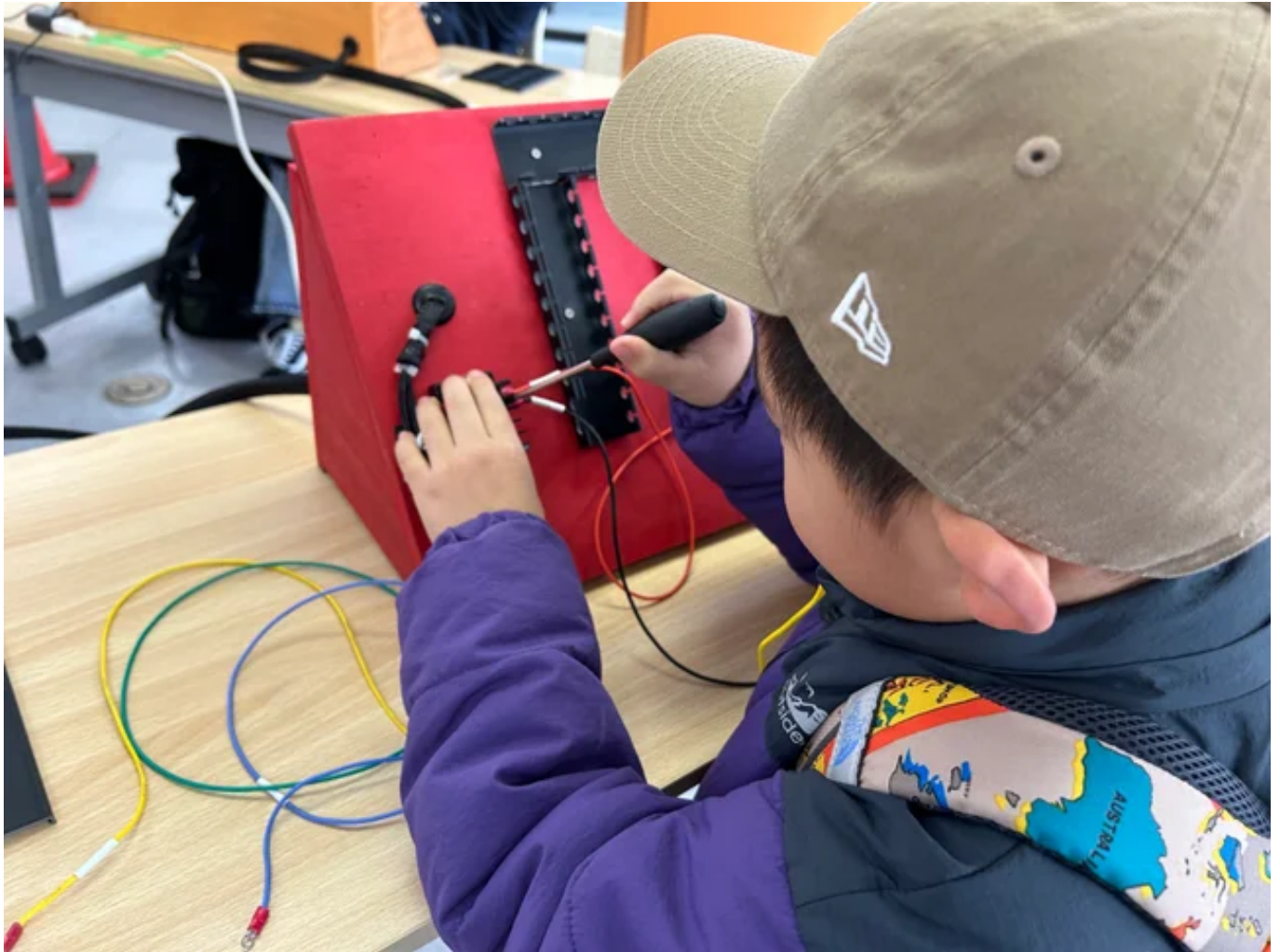
※配線作業体験のイメージ

「配線作業体験」・・・ドライバーを使って正しく配線を繋げて、ライトを点灯しよう！ その他にも技術体験メニューをご用意しております。