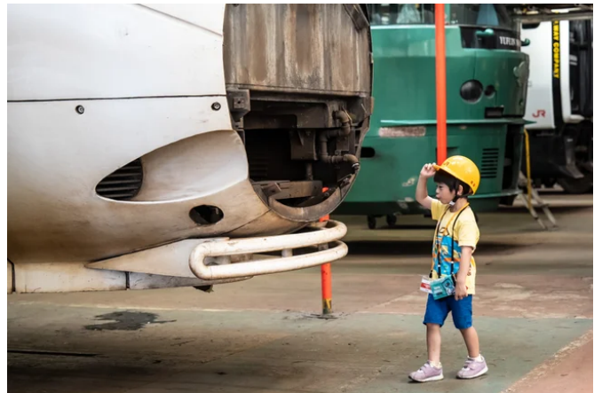
※工場見学のイメージ