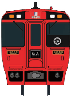
進撃の巨人ラッピングトレインイメージ ©諫山創 / 講談社

日田市内の久大本線（日田駅～天ヶ瀬駅）にあるトンネルの入口4箇所に『進撃の巨人』に関連するアートを設置しました。 ラッピングトレインとあわせて『進撃の巨人』の世界観をお楽しみください。