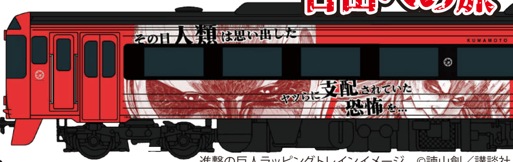
進撃の巨人ラッピングトレインイメージ ©諫山創/講談社