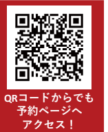
QRコードからでも予約ページへアクセス!