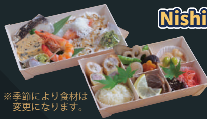
※季節により食材は変更になります。