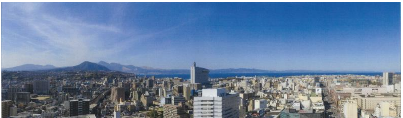
※21F 露天風呂からの眺望