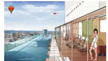
※21F 露天風呂イメージ