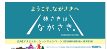
(※おもてなしステッカー)