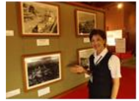
(※写真はイメージです。)