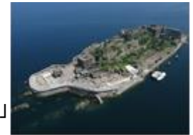
(※写真はイメージです。)