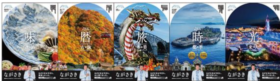
①味(逢路) ②暦(古詠) ③旅(多美) ④時(都季) ⑤光(来人)

長崎DC推進協議会が制作した5連貼りポスターを、平成28年9月1日(木)～30日(金)の間、全国のJR主要駅に掲出します。