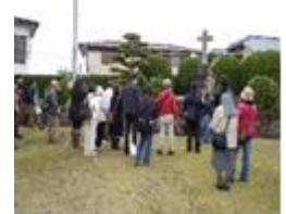
(※写真はイメージです。)

(実施日は、10月9日(日)、10月23日(日)、11月13日(日)、12月11日(日)のみ)