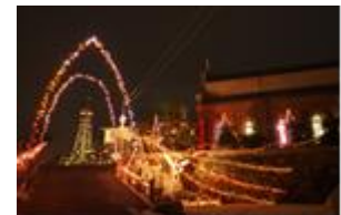
(※写真はイメージです。)

このコンサートに、一日先着10名様(ペア5組※先着順)を長崎DC特別席としてご用意します。