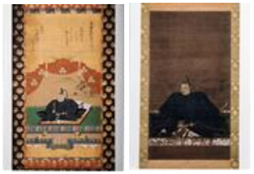
(※写真 左：徳川家康公、右：宗義智公)

徳川家康公と対馬藩初代藩主宗義智（そう よしとし）公の二人の肖像画を、対馬歴史民俗史料館で長崎DC期間中特別公開します（通常非公開）。朝鮮との外交窓口であった対馬藩と徳川幕府との繋がりを垣間見ることができる、ストーリー性を重視した特別企画展です。