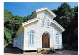
(※写真 左：使用する海上タクシー、右：江上天主堂)