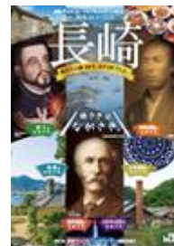
(※ガイドブック表紙)

各エリアの観光情報やキャンペーン期間中に開催される長崎DC特別企画、イベント情報などを掲載した長崎DCガイドブック約40万部を全国のJR主要駅や旅行会社窓口等において配布します。