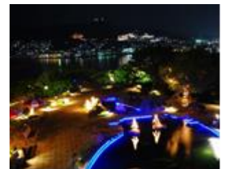
(※写真はイメージです。)

長崎DC期間中の10月22日（土）、10月29日（土）の2日間、ライトアップされた「グラバー園」において、「変面ショー」、「ハウステンボス歌劇団」、「二胡」や「バグパイプ」などによるイベントを実施します。ライトアップされたグラバー園から長崎の夜景を楽しみながら、長崎ならではのショーをお楽しみ下さい。