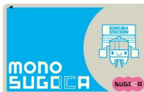
参考 「mono SUGOCA」のデザイン