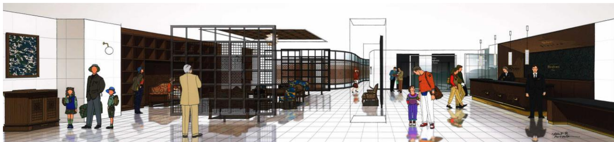
※フロント・ロビーイメージ

白と黒の石材のコントラストが美しいロビーは、中央に位置するソファスペースにオリジナル家具と華やかなペンダント照明を配し、やさしくゲストを迎えます。