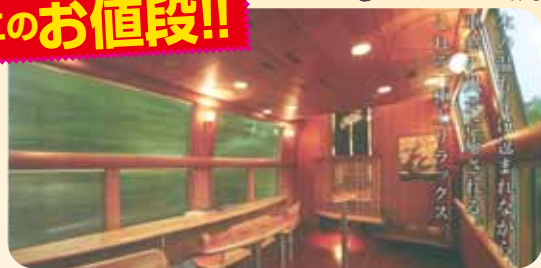
※沿線の風景を眺められるパブリックサロンスペースでは、食事も楽しむ事ができます。(ゆふいんの森3・4号のみ)