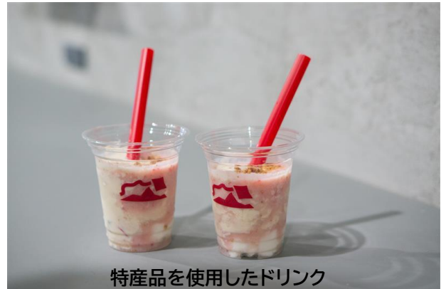
特産品を使用したドリンク

同日、駅及び駅周辺では JR 九州ウォーキング※1や暮らしのヒトタナ市※2も開催します。