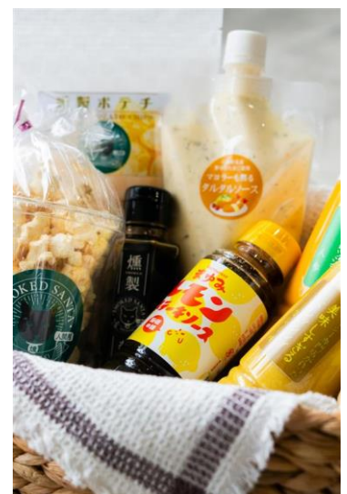
川棚ローカルコレクション商品