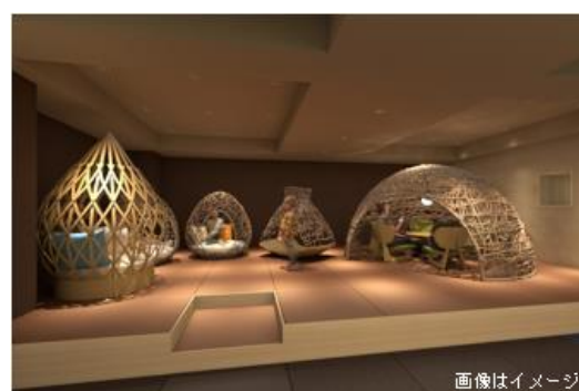
別府温泉 竹と椿のお宿 花べっふ