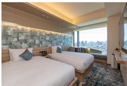
THE BLOSSOM HIBIYA