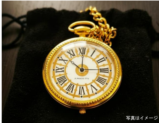
「博多大時計」をモチーフにした懐中時計