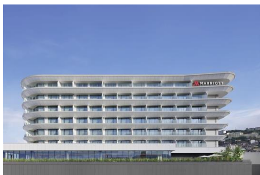
長崎マリオットホテル（外観）