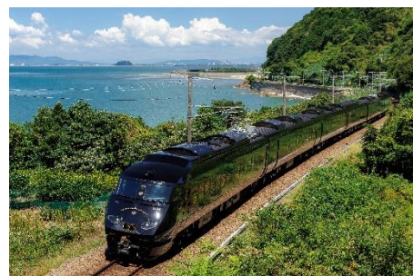
D&S 列車「36 ぷらす 3」