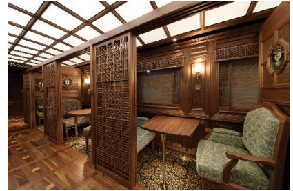
※2号車車内イメージ