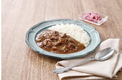
※「或る列車 BEEF CURRY ライス」のイメージ WASARA（紙皿）での提供を予定しております。