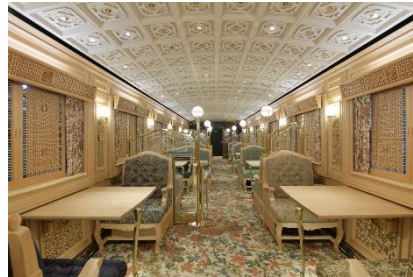
※1号車車内イメージ