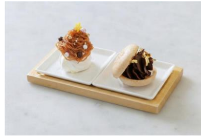
※「ミニスイーツ」のイメージ WASARA（紙皿）での提供を予定しております。