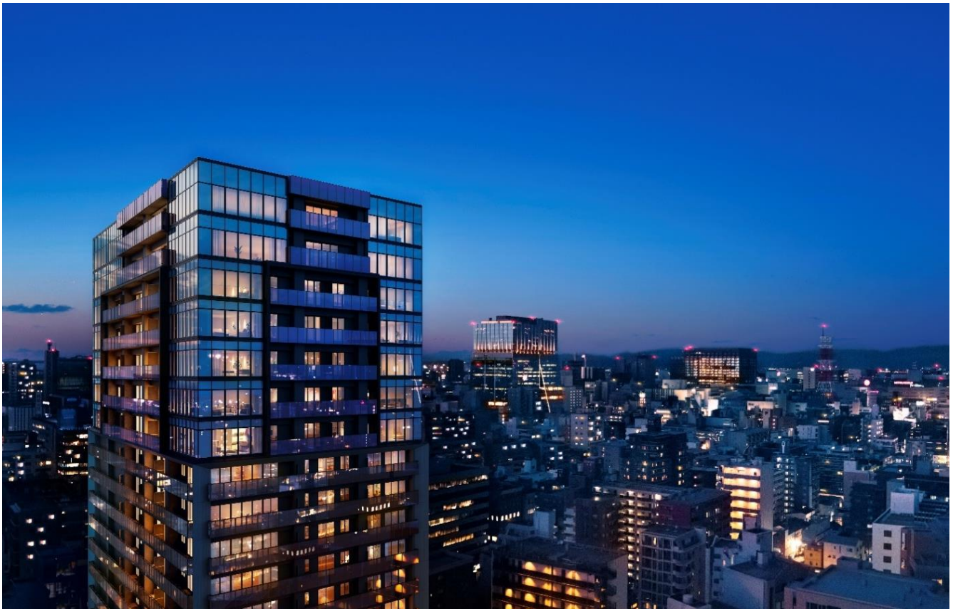
建物完成予想 C G（現地から北東方面を望む）