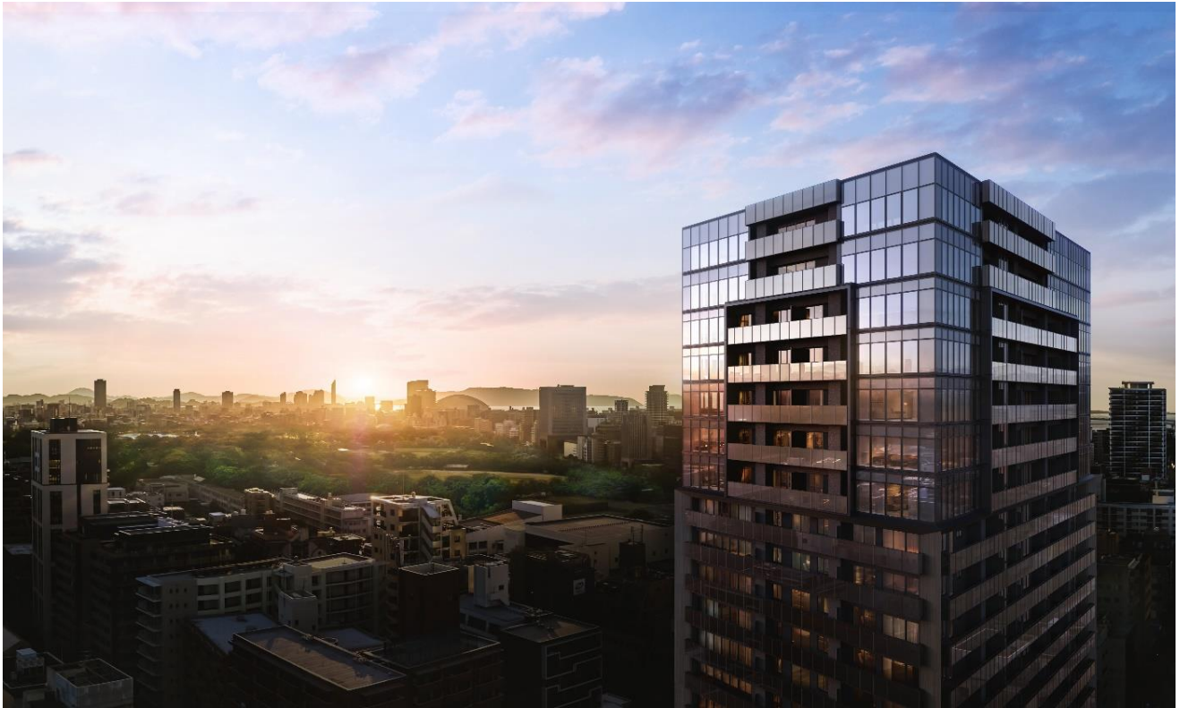
建物完成予想 C G（現地から北西方面を望む）