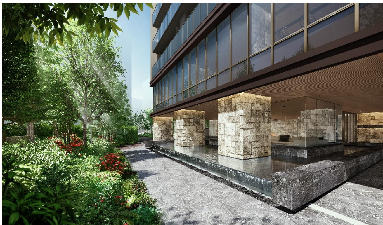
公開空地完成予想 C G