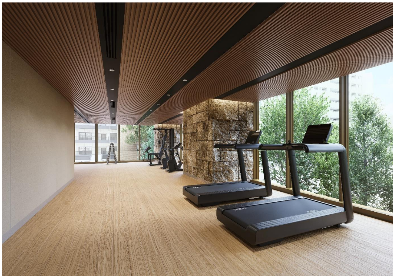
パーソナルジム完成予想 C G