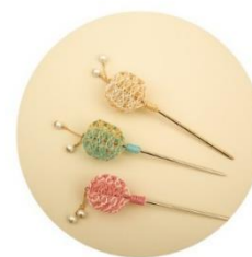
かんざし 各種 税込2,750円