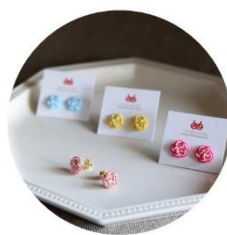
ピアス (うめ) 各種 税込2,420円