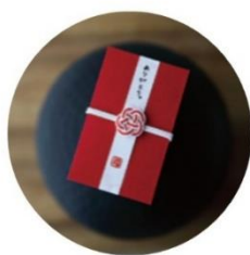
ほちぶくろ 税込275円