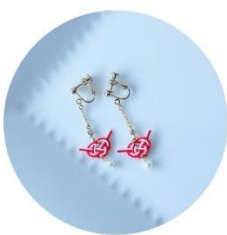
イヤリング (あわじ) 税込1,980円