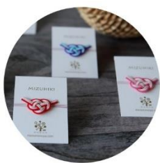
ピンバッチ (あわじ) 税込1,100円