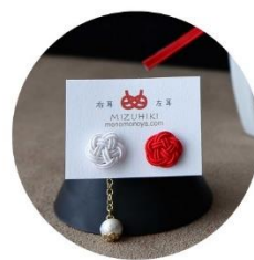
赤白ピアス 税込2,750円