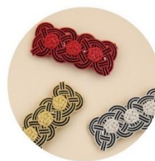
バレッタ 各種 税込1,980円