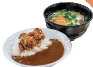
※大人用風食イメージ