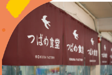
※つばめ食堂イメージ