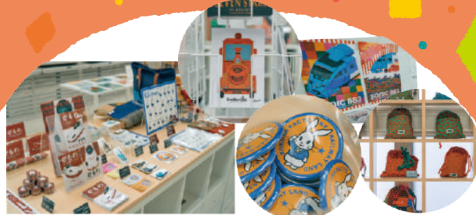
※鉄道ショップKKイメージ

小倉総合車両センターの社員が 使用する現役の社員食堂で風食！ 大人「うどん＋カレー」 子ども「ミニうどん＋おにぎり」 をご用意！