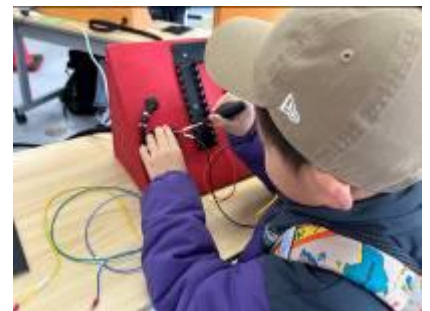
(配線体験イメージ)

“カレー”と“うどん”をセットにしてご用意 (お子さまはミニうどんとおにぎりのセット)