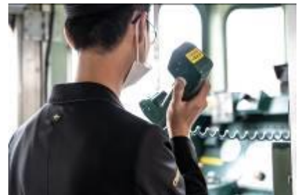
(車内放送体験イメージ)