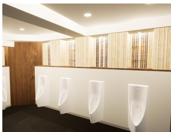
男性用トイレのイメージ(小便器まわり)