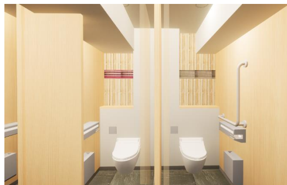
女性用トイレのイメージ(個室ブース内)