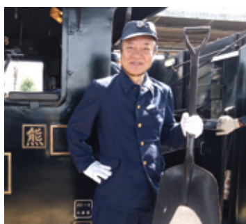
熊本県くまもと鉄道PR大使 くま川鉄道応援アンバサダー かめきち

JR九州の広告写真・CM・公式写真・動画を担当。JR時刻表の表紙や鉄道誌への寄稿も。2004年～広告写真スタジオ勤務、2013年から鉄道広告写真家として独立。