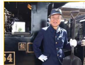
熊本県くまもと鉄道PR大使 かめきち