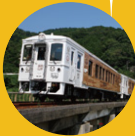
特急 海幸山幸 宮崎-南郷

南九州で活躍する5種類のD&S列車が八代駅に集結!! D&S列車が主役の“鉄”分強めなイベントを開催します。