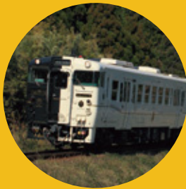
特急 指宿のたまて箱 鹿児島中央-指宿