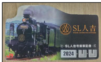
「SL人吉」フォトパネル