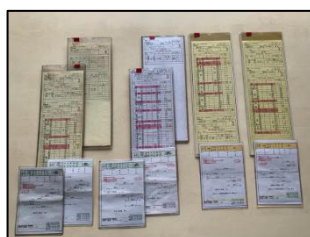
「海幸山幸」ひなたフェス運転士携帯時刻表