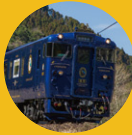
特急 かわせみ やませみ 熊本-阿蘇-宮地