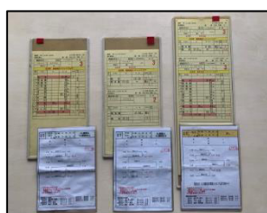
「SL人吉」運転士携帯時刻表 (SL最終運行など)