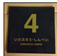
「はやとの風」、「いさぶろう・しんぺい」各種サボ