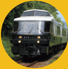
特急 あそぼーい! 熊本-阿蘇-大分-別府