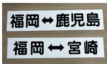
(左)巻取機付き方向幕 (JR九州バス) (右)JR九州バス各種サボ

その他にも、当日、熊本～八代を特別運行する D&S 列車のオリジナルサボ(方向幕)も出品予定！