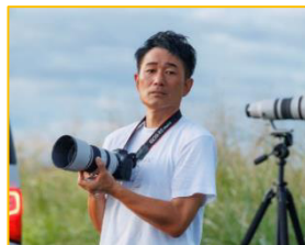
鉄道広告写真家 福島 啓和