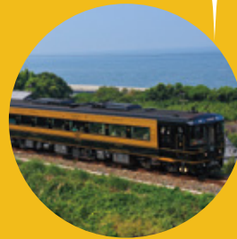
特急 A列車で行こう 熊本-三角