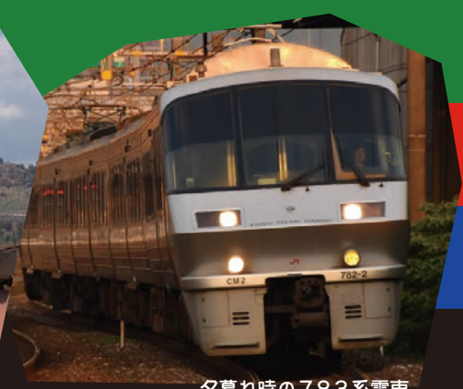
夕暮れ時の783系電車

783系電車は国鉄からJRとなり始めて製造された新型特急列車です。1988年3月13日にデビューして今年で36年目を迎えます。ステンレスの車体に流線形の先頭部、車体中央に1か所設けられたドア、半室ずつに分かれた客室など、斬新なデザインで注目をあつめました。ハイパーサールの愛称で親しまれたこの車両は「有明」として博多～熊本～西鹿児島（当時）で運行を開始し、1989年には長崎行きの「かもめ」、1990年には大分方面への「にちりん」としても運行し、その後鹿児島本線では「ドリームつばめ」、佐世保行きの「みどり」、ハウステンボス行きの「ハウステンボス」、宮崎方面でも「ドリームにちりん」「にちりんシーガイア」として運行され、九州全域を駆け抜けた列車です。また、一時期は「ソニック」「きらめき」「ひゅうが」「きりしま」「かいおう」として運行されたこともあり、JR九州で運行しているほとんどの特急列車の名前を冠して運行したことも783系電車の歴史です。