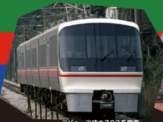
デビュー当時の783系電車