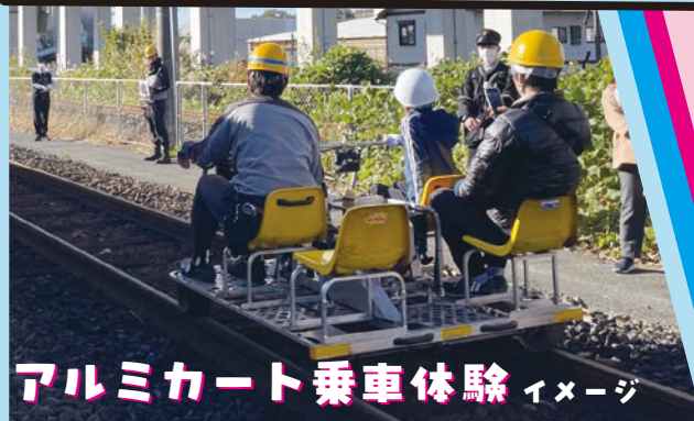
アルミカート乗車体験 イメージ