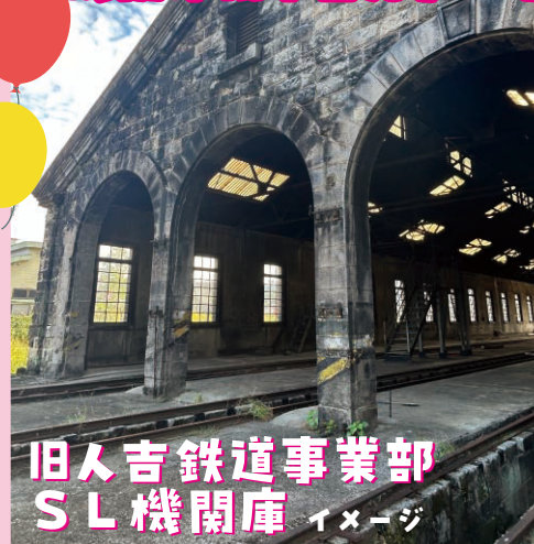
旧人吉鉄道事業部 SL機関庫 イメージ