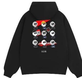
【NFT】※開発中のイメージです。