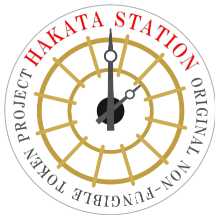
「JR九州博多駅オリジナル NFT」ロゴ

「JR九州 NFT」では、今後も鉄道を活用したコンテンツをご用意してまいりますのでご期待ください。