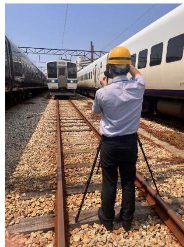
素材を撮影する博多駅社員の様子