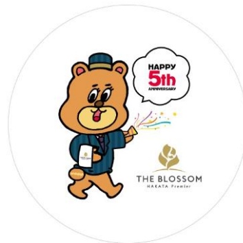
THE BLOSSOM HAKATA Premier の制服をモチーフに デザインされた「サトーくん(ON SUGAR 宣伝部長)」