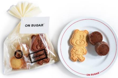
ON SUGAR の大人気商品「サトーくんクッキー」

2024年9月24日(火)・25日(水)の2日間、当ホテルにチェックインをされたお客さまには、ON SUGARのマスコットキャラクター「サトーくん」とコラボしたオリジナル限定ステッカー&クッキーをプレゼントいたします。 ※先着順・数量限定の為、無くなり次第終了とさせていただきます。 ※プレゼントは一室一個となります。