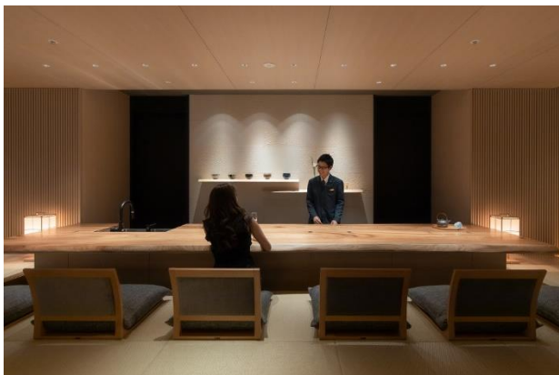
当ホテル最上階の特別客室フロア(HAKATA Floor)にある クラブラウンジ「HAKATA LOUNGE」