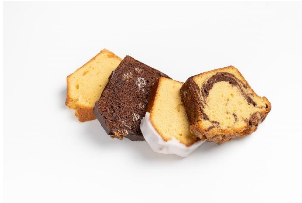
今夏、新たに「HAKATA LOUNGE」へ導入された ON SUGAR のパウンドケーキ(画像はイメージです)