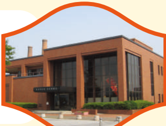
田川市石炭・歴史博物館

田川市石炭・歴史博物館 日本で初めてユネスコ『世界の記憶』(世界記憶遺産)に登録された「山本作兵衛コレクション」697点のうち、627点を所蔵し、屋外には実際に炭坑で使用された大型機械類や復元された炭坑住宅も展示されています。