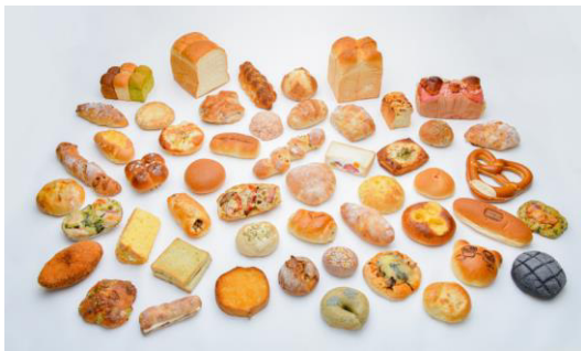
かわさきパン博（イメージ）

また、英彦山神宮の参拝や田川市石炭・歴史博物館に立ち寄り、田川地区の観光も楽しめるツアーとなっております。皆さまのご参加をお待ちしております。