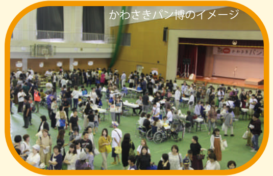
かわさきパン博のイメージ

また、川崎町産の食材を使用したパン博限定パンも登場！ おいしいパンと楽しい時間をお過ごしください。