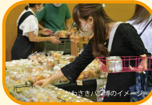
かわさきパン博のイメージ