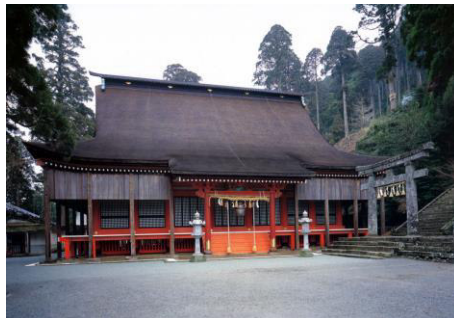
英彦山神宮奉幣殿