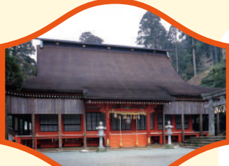
英彦山神宮奉幣殿

英彦山神宮 日本三大修験山の一つとして、古くから人々の信仰を集めてきた英彦山。神宮の主祭神として祀られているのは、かつて鷹の姿をして田川の地に現れたと伝わる天忍穂耳命(アメノオシホミミノミコト)。農業や鉱山、工場の守護神、また勝運の神様として敬われています。