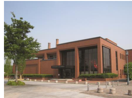
田川市石炭・歴史博物館