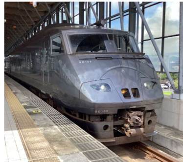
特急ひゅうが号（延岡～宮崎空港）