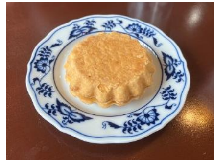
※商品はイメージです。