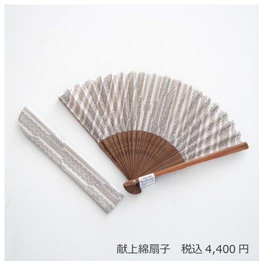
献上綿扇子 税込 4,400 円