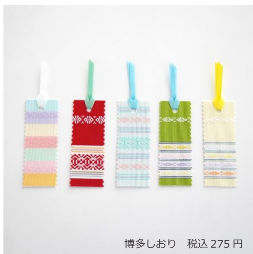
博多しおり 税込 275 円

店内では、博多織小物を直接手に取っていただき、その繊細な手触りと温もりを感じていただけます。ぜひ博多の文化に触れてみてはいかがでしょうか。