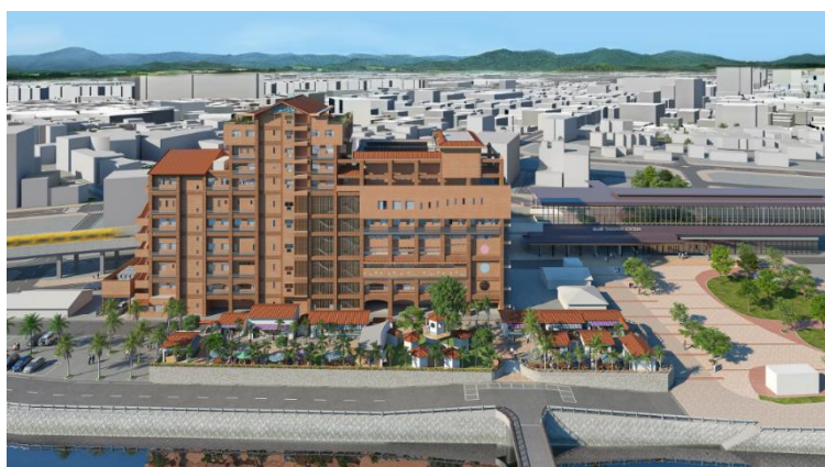
2023 年 12 月にオープンした「La Plus」