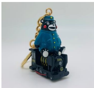
立体キーホルダー 1,200円 (くまモン ver)