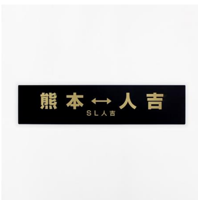
SL人吉サポ（レプリカ） 4,950円