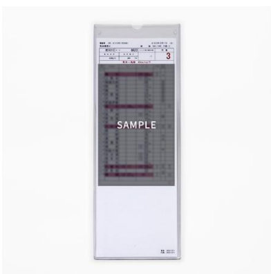
3/23 博多→熊本特別運行当日の 携帯用運転士時刻表（レプリカ） 3,300円