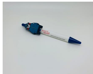
ボールペン 1,000円 (くまモン ver)