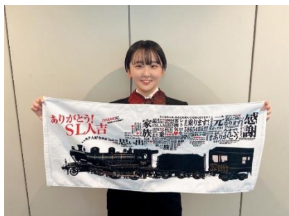
フェイスタオル 2,000円