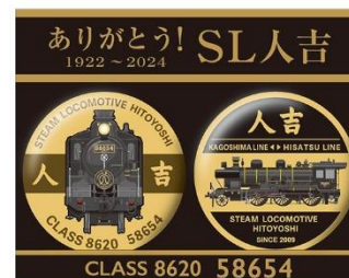
バッジ等各種グッズ