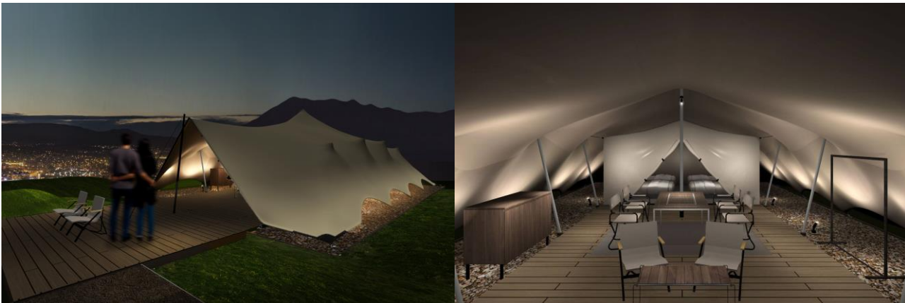
[客室詳細 - TENT]

スノーピークが YAKEI SUITE のために開発した特別仕様のテント「LAND CAVE ランド ケイヴ 」。キャンプ体験に近づけることを考えて設計されたテントでは、幕一枚越しに自然を感じる贅沢さを味わうことができます。