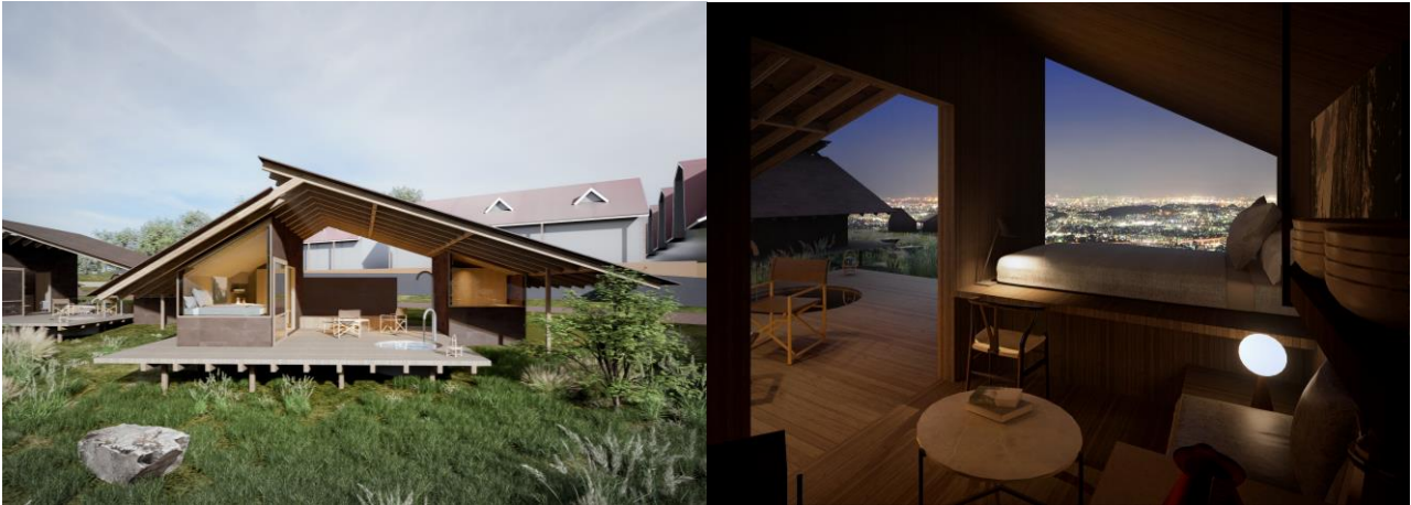
[客室詳細 - COTTAGE]

アウトドア・リビングでは、プライベートサウナで整い、大切な人とのお食事を愉しむことができます。また、寝室の大きな窓ガラスから見える夜景を眺めながら眠りにつくことが出来るのもコテージの特徴です。