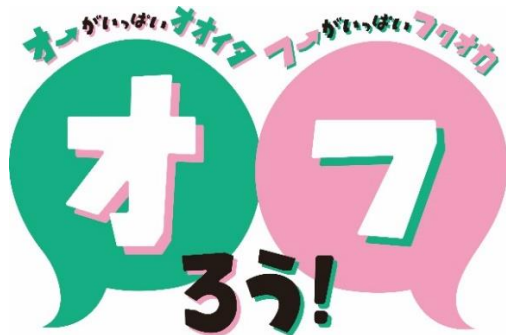
歩いて楽しむ! 福岡・大分観光キャンペーン