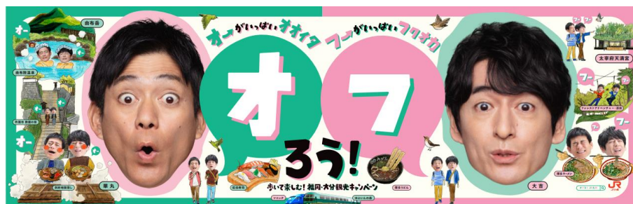
【B3 ワイド(在来線列車内)】