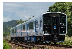
BEC819 系架線式蓄電池電車 (JR 九州)