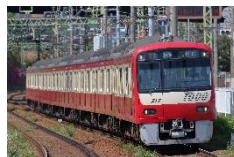
1000 形電車 (京急電鉄)