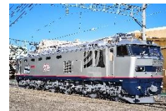
EF510 形式電気機関車 (JR 貨物)