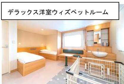
デラックス洋室ウィズペットルーム