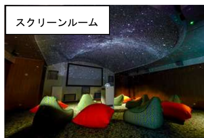
スクリーンルーム