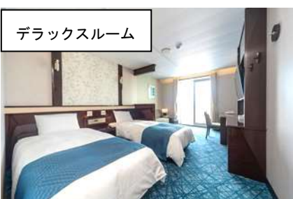
デラックスルーム