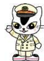
▲JR東日本水戸支社 E657系 イメージキャラクタームコナくん