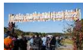
IBARAKI CAMP AUTUMN FESTA 2022の様子▲