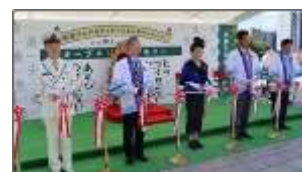
▲昨年のプレDCの様子(セレモニー)