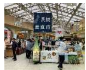
▲昨年の産直市の様子