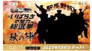
▲ティザービジュアル