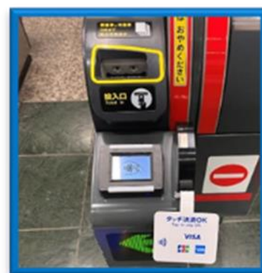
(出場時に専用端末へタッチ)