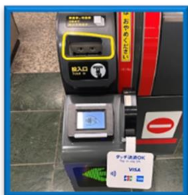
(入場時に専用端末へタッチ)