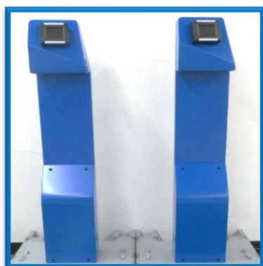
(ポール型専用端末)