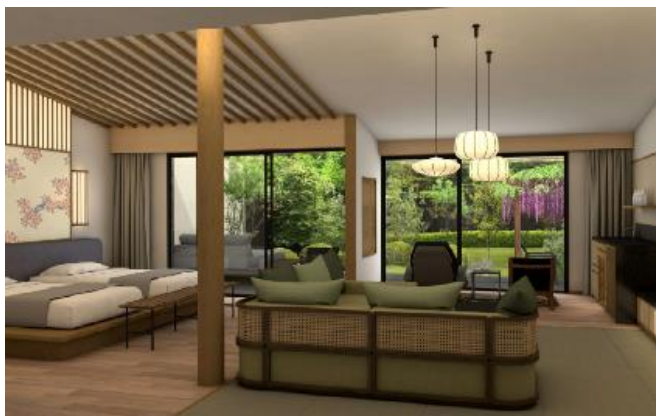
【離れ棟 ラグジュアリースイート(イメージ)】