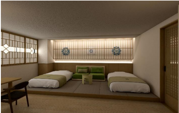
【母屋棟 ジュニアデラックス(イメージ)】