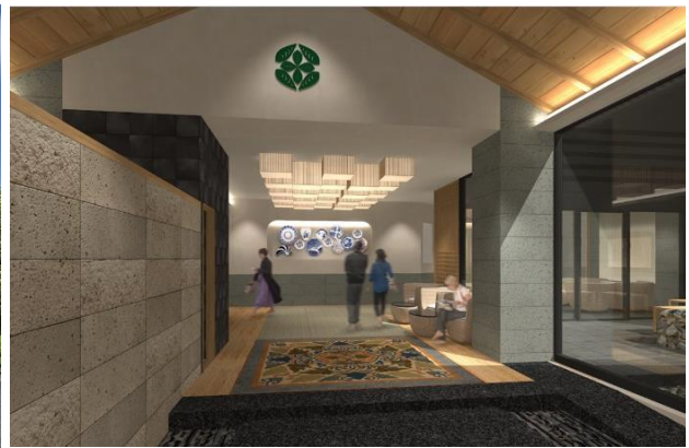
【エントランス(イメージ)】