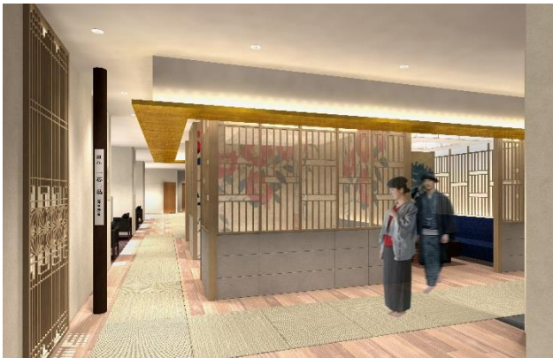
【ラウンジ(イメージ)】