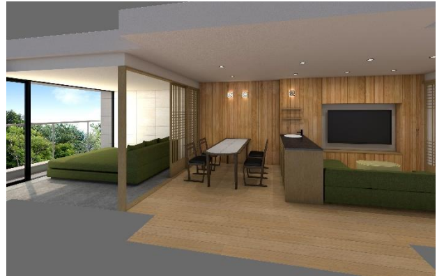
【母屋棟 コンフォートデラックス(イメージ)】