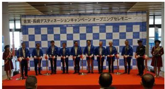
佐賀・長崎DCオープニングセレモニー