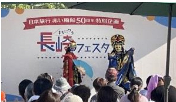
まちにワク長崎フェスタ（長崎市出島ワープ）