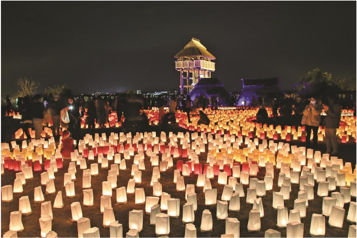
メイン会場「南内郭」の様子