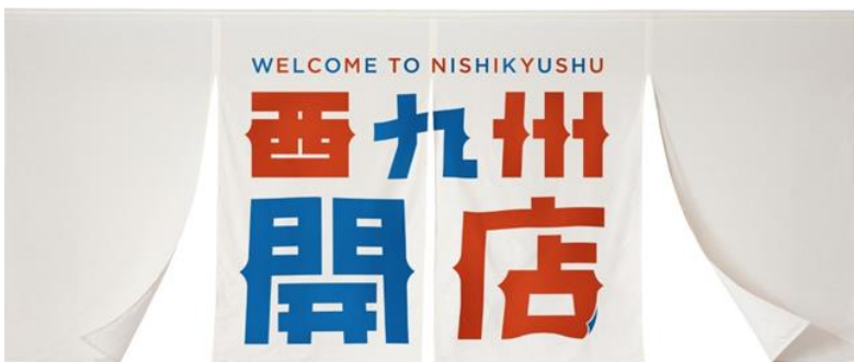
【キャンペーンキャッチコピー】

JR九州とJR西日本では、「博多華丸・大吉」のおふたりをキャンペーンタレントとして、「西九州開店」をキャッチコピーに「新しい西九州の旅」をご紹介しています。“まち歩き”、“食”、“ひと”などをテーマに西九州の魅力を発信しています。また、期間限定の割引きっぷも発売中ですので、ぜひご利用ください。 (2023年3月31日まで開催)