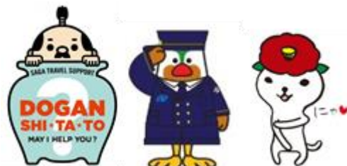
▲左から順に 佐賀県観光PRキャラクター 壺侍 長崎県PRキャラクター がんばくん 長崎県五島市PRキャラクター つばきねこ

佐賀県・長崎県の観光情報が満載のパンフレット等をお配りし、両県のたくさんの魅力をご紹介します。 また、会場の大型スクリーン（O-Vision）では、両県のおすすめ観光地や開業したばかりの西九州新幹線など「新しい西九州旅」をご紹介します動画を放映します。 さらには、両県のPRキャラクターも気まぐれで登場するかも？