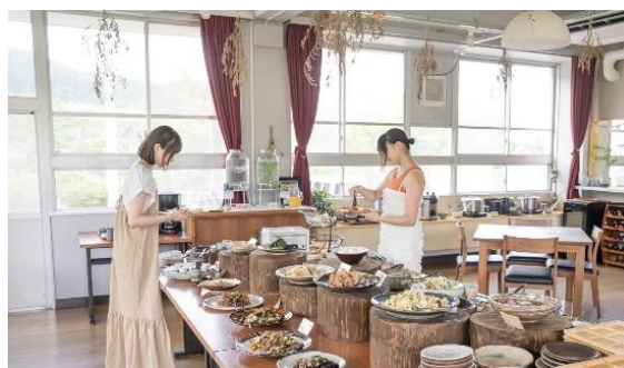
【レストラン「ふえありお」】