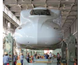
車体上げは熊本のための実施です