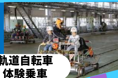
● 軌道自転車 体験乗車