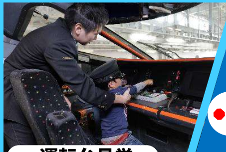
● 運転台見学 (ツアー-参加者限定)