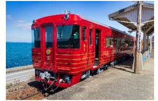
伊予灘ものがたり