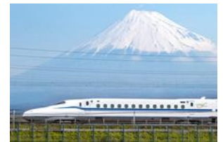
東海道新幹線 のぞみ (N700S)