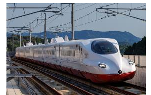
西九州新幹線 かもめ