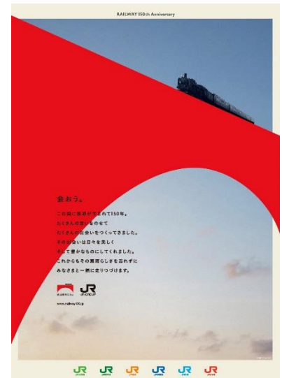
ポスター（イメージ）