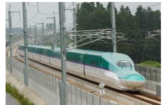
北海道新幹線 はやぶさ (H5)