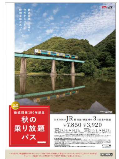
「鉄道開業150年記念 秋の乗り放題パス」ポスター

※STATION STAMPの対象駅は、WEBアプリ「TRAIN TRIP」からSTATION STAMP内の「よくあるご質問」でご確認いただけます。