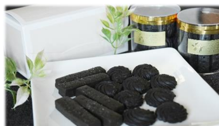
竹 Summy ショートブレッド・サブレ