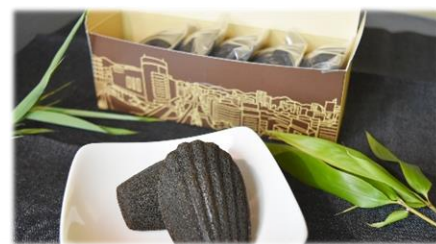
竹 Summy マドレーヌ(5 個入り)