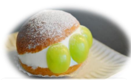
マリトッツォ (マスカット)