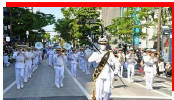
海上自衛隊佐世保音楽隊