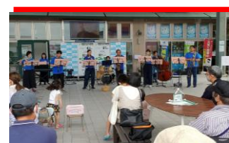
大村ウインドアンサンブル