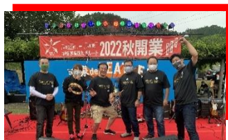
温泉 de ビートルズ音楽祭実行委員会