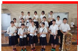
佐賀県立唐津西高等学校