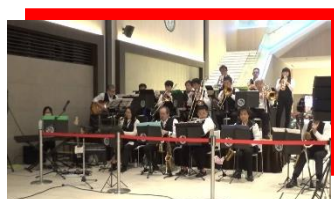
IBJ 諫早ビッグオーケストラ