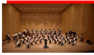
長崎市立長崎商業高等学校