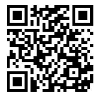
▲ 特設サイト QR コード

URL： https://www.jrkyushu.co.jp/train/kamomegakudan/