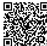
▲ LINE 申込 QR コード