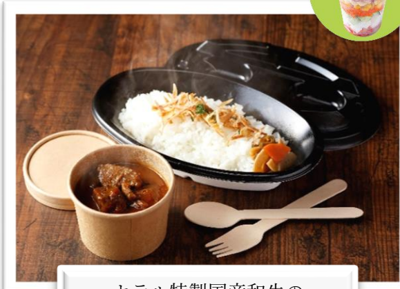
ホテル特製国産和牛の 熟成スパイシーカレー 1,300 円(税込)