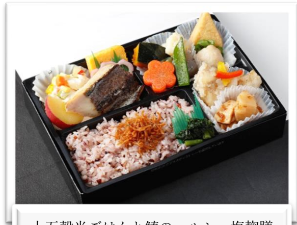
十五穀米ごはん と 鱈のヘルシー塩麹膳 1,620 円(税込)