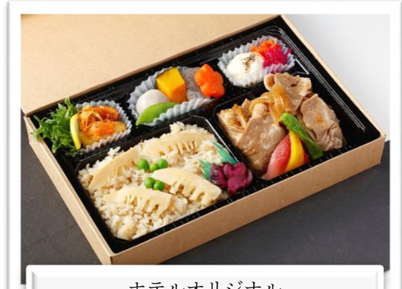
ホテルオリジナル 筍御飯ときじょん山豚の生姜すき膳 2,160 円(税込)