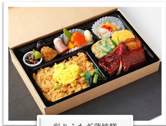
彩りうなぎ蒲焼膳 2,160 円(税込)