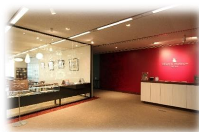
ゼンリンミュージアム 内観

販売開始日：2022年2月22日(火) 利用開始日：2022年3月1日(火) 運営：JR九州ステーションホテル小倉 URL： https://www.station-hotel.com/