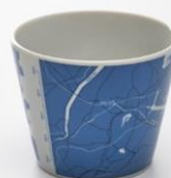
地図柄フリーカップ