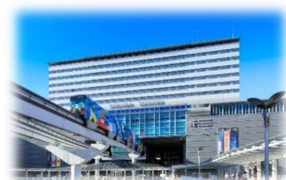
JR九州ステーションホテル小倉 外観

愛称：地図さんぽの部屋 企画：JR九州ステーションホテル小倉株式会社 株式会社ゼンリン 所在：15階 スタンダードツインルーム（1室限定） 期間：2022年3月1日(火)～2023年2月28日(火)