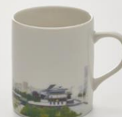
地図柄マグカップ