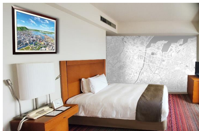
地図さんぽの部屋 イメージ