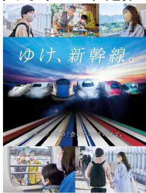
ポスター（イメージ）

スペシャルムービーはJRグループ Twitter 公式アカウントやYouTubeでもご紹介しますので、是非ご覧ください！