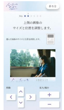
ポスターメーカー（イメージ）

Step3：ハッシュタグ「#会いたいをのせて」「#ゆけ新幹線」を付けて、オリジナルポスターを投稿。